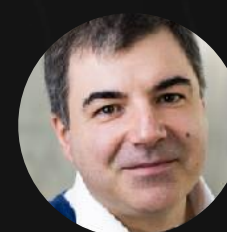
Константин Новоселов Лауреат Нобелевской премии по физике