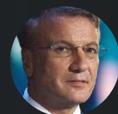
Герман Греф Президент, Председатель Правления ПАО Сбербанк

Сопредседатели Комитета Премии в 2022 году