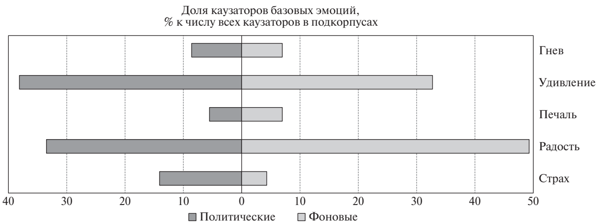
Рис. 1. Количество лексем в роли каузаторов при эмоциях, % к суммарному количеству лексем в роли каузаторов при любых предикатах в сравниваемых подкорпусах

Далее можно искать значимые различия между корпусами текстов по представленности лексем определенной тематики в роли каузаторов эмоций. Как мы уже говорили, определенные тематические группы слов (ТГС) заданы словарными списками в лингвистическом анализаторе (но могут быть и созданы специально под задачи конкретного исследования). Можно также создавать различные рейтинги лексем (без объединения их в ТГС) или вычислять каузативный потенциал наиболее интересных для исследования лексем. Ниже представлены результаты обоих способов анализа данных.