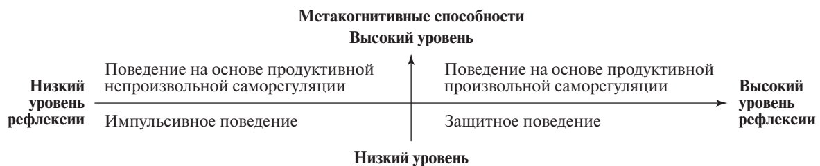
Эффект расщепления высоких и низких показателей рефлексии

Таким образом, в качестве основного критерия, обеспечивающего эффект расщепления высоких и низких показателей рефлексии, выступают