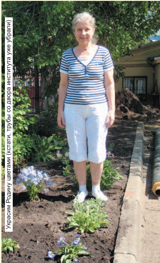
Украшим Родину цветами (кстати, трубы со двора института уже убрали)