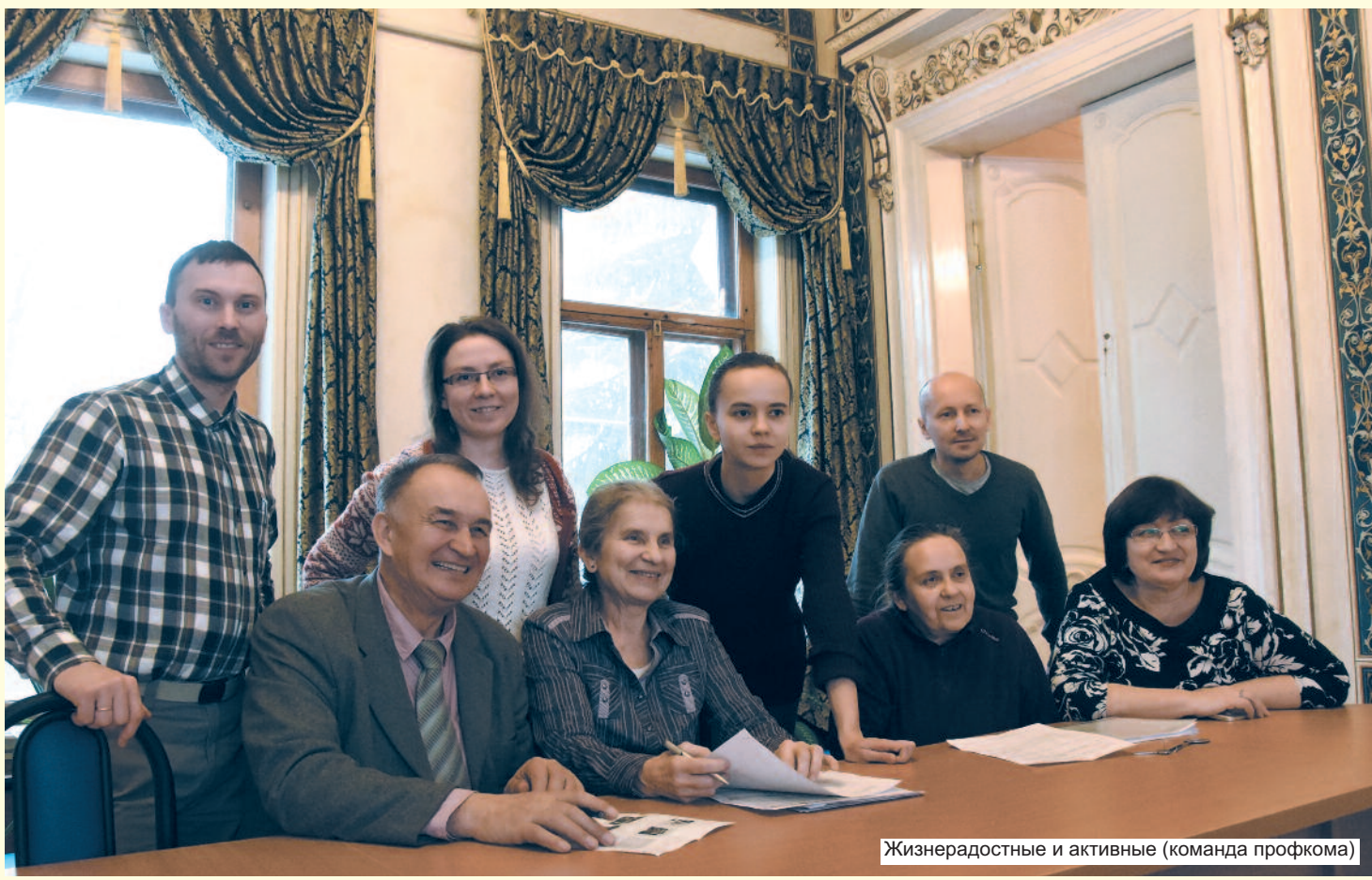
Жизнерадостные и активные (команда профкома)

Созданная с ее участием в 1995 г. астрофизиками Австрии, России и Швеции Венская база атомных параметров спектральных линий (VALD) широко используется астрономами всего мира при анализе спектров звезд. С 2010 г. VALD вошел в состав Виртуального центра атомных и мо-