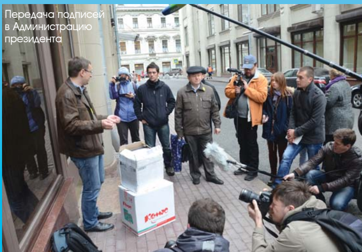
Передача подписей в Администрацию президента

Конечно, научная общественность не ждала, что Совет Федерации примет самостоятельное решение: принципы работы нашего парламента всем известны. Так и вышло: верхняя па-