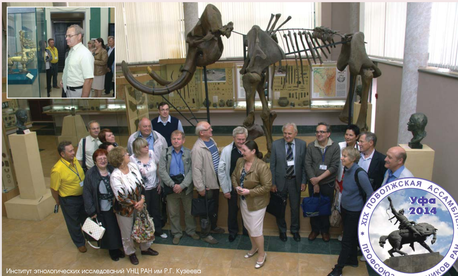
Институт этнологических исследований УНЦ РАН им Р.Г. Кузеева

главы государства по зарплатам федеральные органы, похоже, обязали добиваться любой ценой. Крайними пытаются сделать директоров институтов. Они получили из ФАНО на подпись дополнения к трудовым соглашениям, в соответствии с которыми на них возлагается обязанность повышать зарплаты по графику.