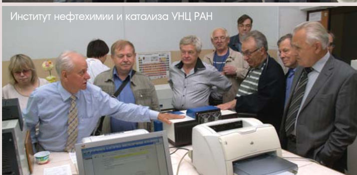
Институт нефтехимии и катализа УНЦ РАН