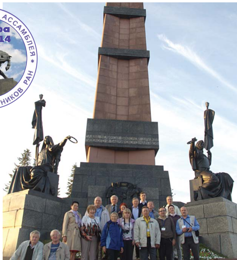
Ботанический сад-институт УНЦ РАН