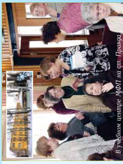
В учебном центре МФП на ст. Правда