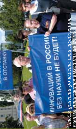
Чтобы донести до власти свои требования, ученым приходится выходить на улицы