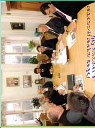
Рабочая встреча руководства и профсоюза РАН