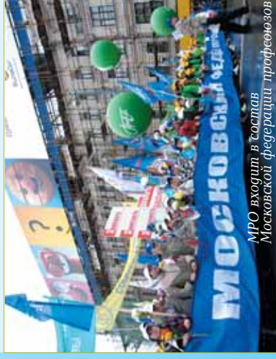
МРО входит в состав Московской федерации профсоюзов