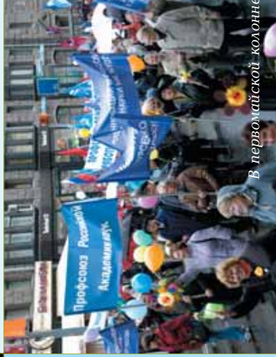
В Первомайской колонне