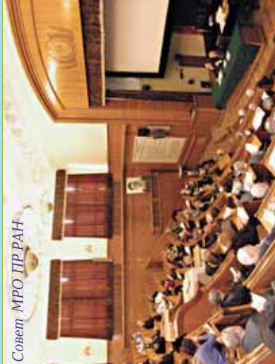
Совет МРО ПР РАН