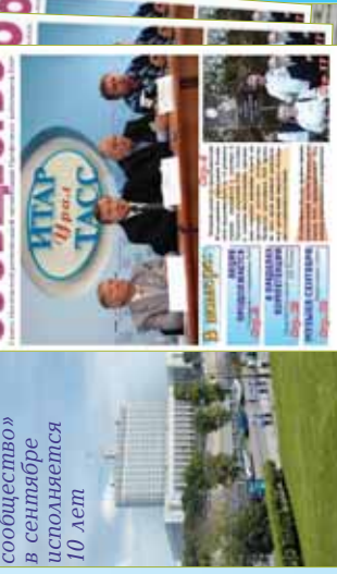
«Сообщество» в сентябре исполняется 10 лет