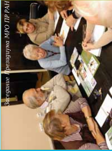
Заседание Президиума МРО ПР РАН