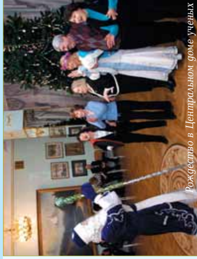
Рождество в Центральном доме ученых