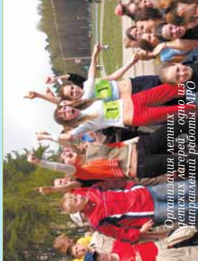
Организация летних детских лагерей - одно из направлений работы МРО