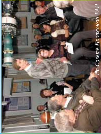
На Совете Профсоюза РАН