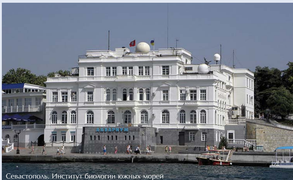
Севастополь. Институт биологии южных морей