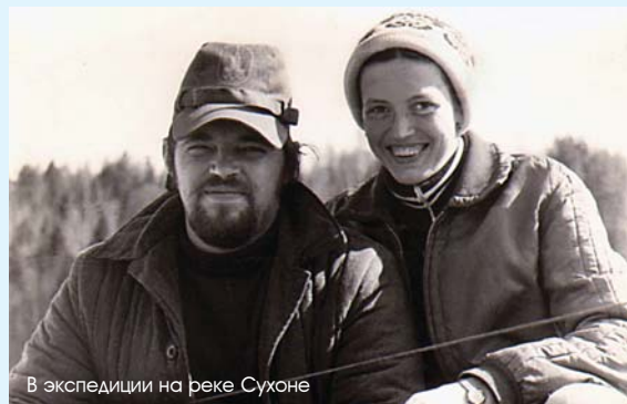
В экспедиции на реке Сухоне

- Когда я какие-то документы прошу посмотреть, мне не отказывают. Но в целом это закрытая информация. Про зарплаты я знаю, поскольку подписываю штатное расписание.