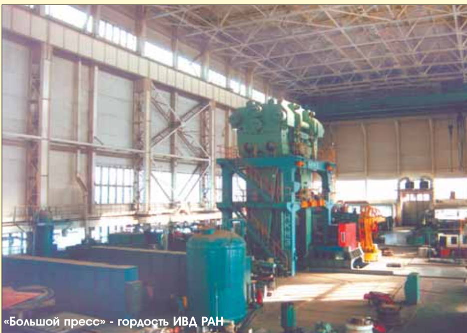
«Большой пресс» - гордость ИФВД РАН

Существует не подтвержденное документально мнение, что одной из основных причин создания ИФВД, явилась необходимость решить проблему синтеза алмазов. В 1955 году в печати появились сообщения, что шведская лаборатория компании АСЕА и независимо от нее лаборатория американской компании Джeneral Электрик смогли синтезировать искусственные алмазы. Если в Швеции патент не был получен и производство синтетических алмазов не было налажено, то американцы свое изобретение запатентовали и уже в 1957 году начали промышленное производство синтетических алмазов. Кроме того, в том же году в