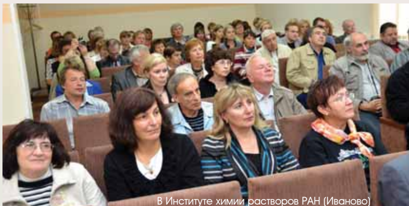
В Институте химии растворов РАН (Иваново)