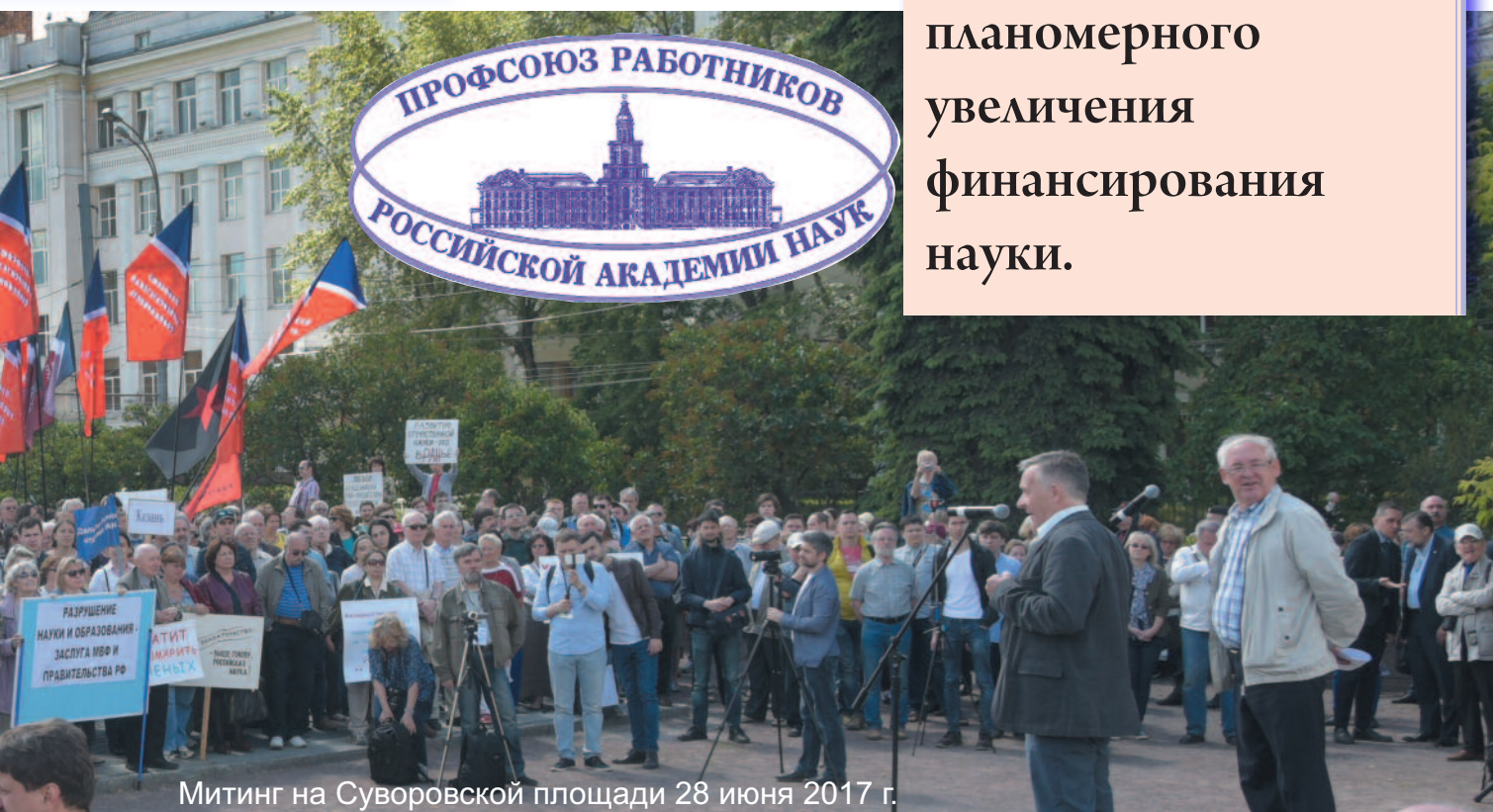
Митинг на Суворовской площади 28 июня 2017 г.

Планируемый рост расходов на науку поможет решить только часть проблем. Поэтому Профсоюз работников РАН продолжит добиваться устойчивого и планомерного увеличения финансирования науки.